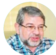
ALQUERMES VALVASORI, PREFEITURA DE LIMEIRA