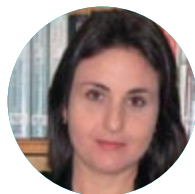
ALESSANDRA OURIQUE DE CARVALHO HESKETH ADVOGADOS